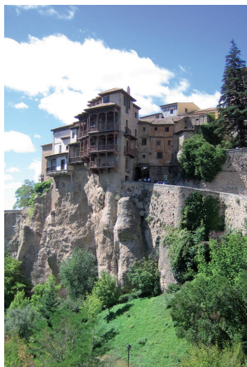
Casas colgadas de Cuenca.